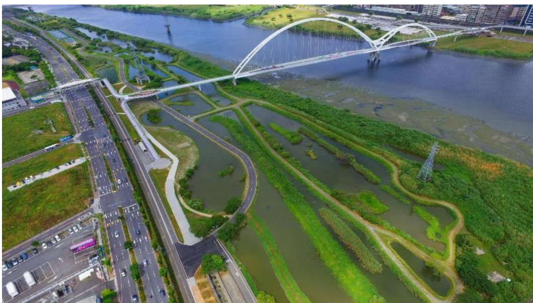
展覽活動主要地點：新海二期人工濕地 (新月橋板橋端)

活動辦理地點以新月橋板橋端( https://reurl.cc/Ge3VRv )為主，創作範圍主要位於新海二期人工濕地。前置創作、物品存放以及休息，可於新月橋下貨櫃屋工作站進行。